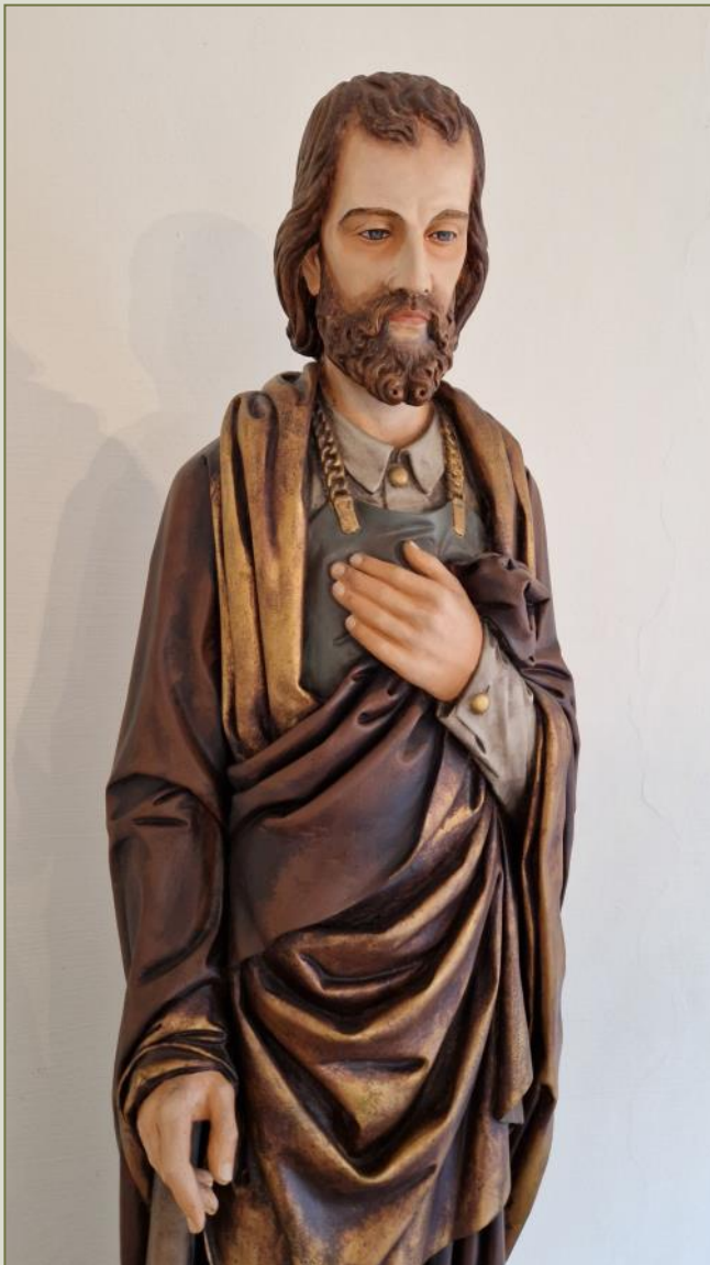
Statue des Hl. Josef im Kreuzgang des Klosters

nannt und hat auch dieses Handwerk ausgeübt, weil er es von seinem Vater gelernt hat. Josef steht gläubig in der Reihe des Volkes Israel. So erfüllt er als wirklicher Vater seine „Pflicht“ – auch im Wissen, dass er sich für den Sohn des allerhöchsten Gottes müht Vater zu sein.